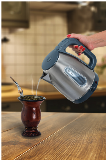
ilustração de cuiá (☺). Esta marcação indica a temperatura de 70°C, ideal para o consumo de chás e chimarrão. Você pode manter a água nesta temperatura para degustar suas bebidas favoritas.

NOTA: No corpo da chaleira, ao redor do botão seletor de temperatura, existe uma